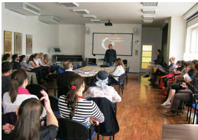
Z veřejných přednášek OÚ