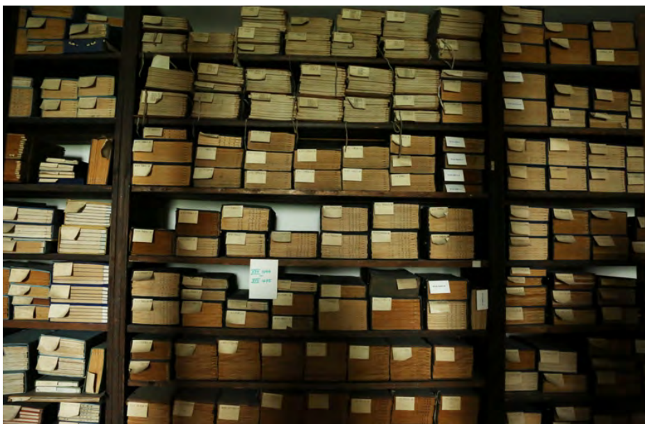
Lu Sünova knihovna obsahující specializované čínské fondy

Ústav spolupracuje s veřejnými sdělovacími prostředky, jeho pracovníci pravidelně poskytují konzultace a vystupují v rozhlase a televizi s informacemi a komentáři k aktuálnímu dění v zemích, které jsou předmětem jejich výzkumné činnosti. Stejně tak poskytují konzultace ministerským resortům ČR a dalším státním orgánům.