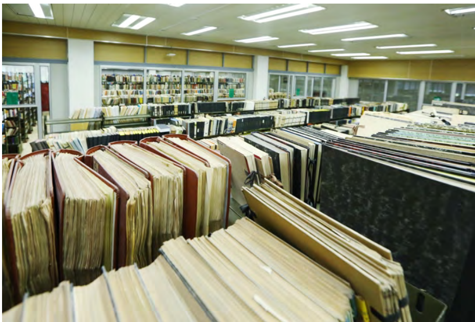
Všeobecná knihovna OÚ čítající více než 200 000 svazků

Orientální ústav spravuje rozsáhlou všeobecnou knihovnu (více než 200 000 svazků) a specializované knihovny v orientálních jazycích . Všechny tyto fondy jsou přístupné veřejnosti.