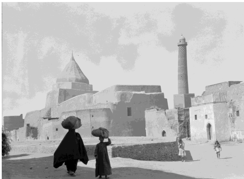
A4. Obr. 1

Břeh Tigridu a východní část historického Mosulu s mostem na leteckém snímku T. J. Bradleyho z let 1928–1929.