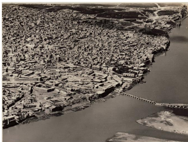
A1. Obr. 5

Břeh Tigridu a východní část historického Mosulu s mostem na leteckém snímku T. J. Bradleyho z let 1928–1929.