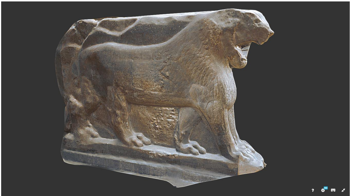
A9. Obr. 8

Kompletní výstup rekonstrukce metodou fotogrammetrie.